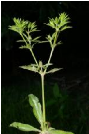
APIACEAE - Eryngium foetidum L.