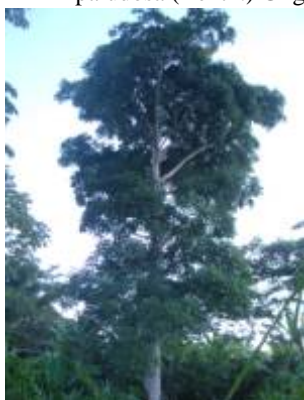
ANACARDIACEAE - Spondias mombin L.