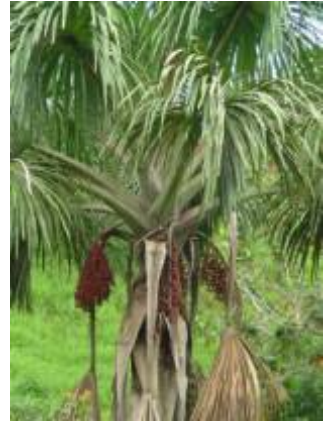
ARECACEAE - Mauritia flexuosa L. f.