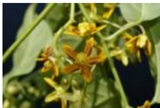
APOCYNACEAE sp. 2