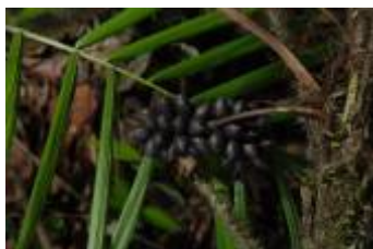
ARECACEAE - Bactris concinna Mart.