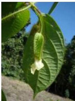
ACANTHACEAE - Mendoncia hoffmannseggiana Nees vel sp. aff