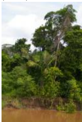
ARECACEAE - Astrocaryum murumuru Mart.