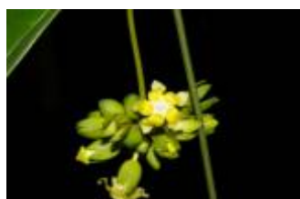
APOCYNACEAE - Prestonia trifida (Poepp.) Woodson