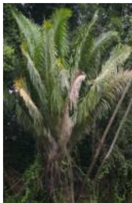
ARECACEAE - Attalea phalerata Mart. ex Spreng