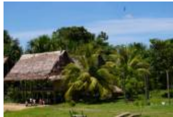
ARECACEAE - Cocos nucifera L.