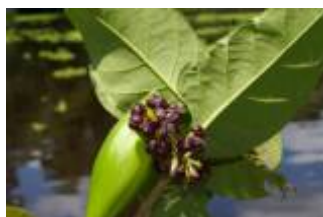
APOCYNACEAE - Marsdenia rubrofusca E. Fourn.