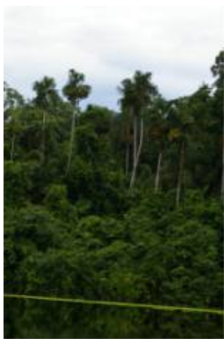
ARECACEAE - Socratea exorrhiza (Mart.) H. Wendl.