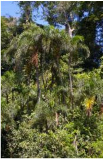
ARECACEAE - Bactris riparia Mart.