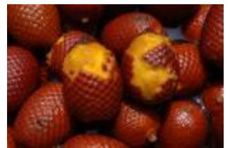
ARECACEAE - Mauritia flexuosa L. f.