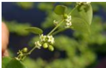
APOCYNACEAE sp. 1