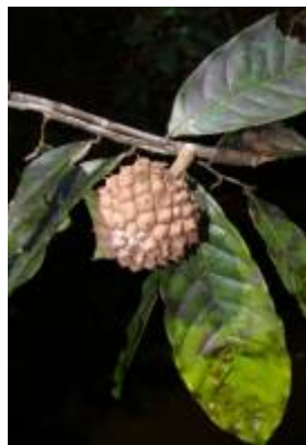
ANNONACEAE - Duguetia spixiana Mart.