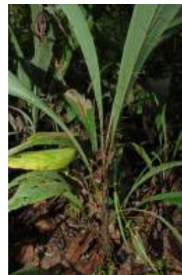
ARECACEAE - Bactris bifida Mart.