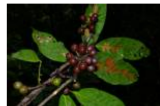
ANNONACEAE - Unonopsis floribunda Diels