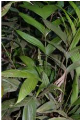
ARECACEAE - Geonoma macrostachys Mart.