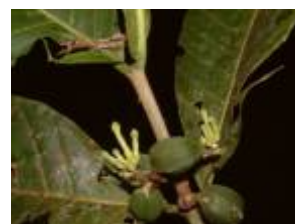
APOCYNACEAE - Tabernaemontana markgrafiana J.F. Macbr.