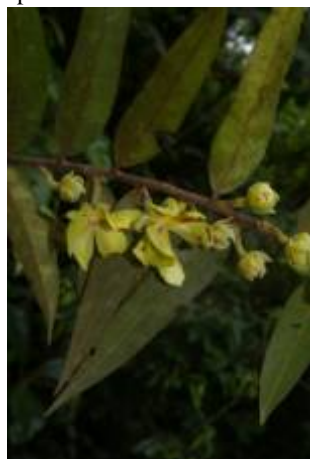
ANNONACEAE - Guatteria sp. 1