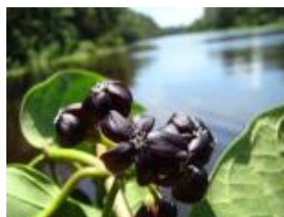
APOCYNACEAE - Marsdenia rubrofusca E. Fourn.