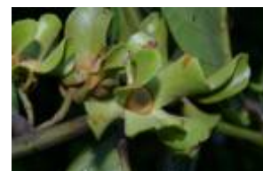
ANNONACEAE - Guatteria olivacea R.E. Fr.