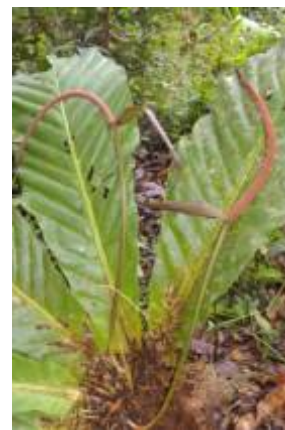
ARACEAE - Anthurium sp. 5