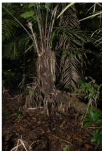
ARECACEAE - Phytelephas macrocarpa Ruiz & Pav.