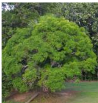
ANACARDIACEAE - Mangifera indica L.