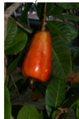
ANACARDIACEAE - Anacardium occidentale L.