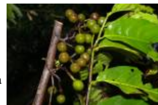
ANNONACEAE - Unonopsis floribunda Diels