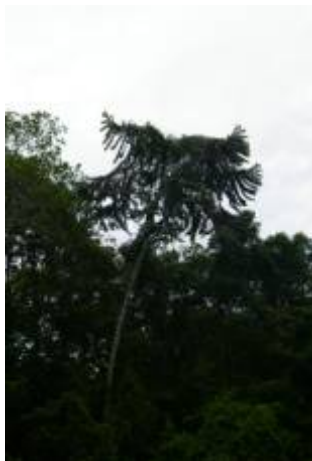
ANNONACEAE - Xylopia poeppigii R.E. Fr.