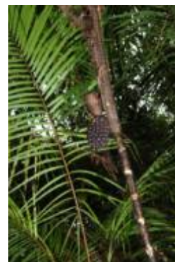
ARECACEAE - Bactris martiana A.J. Hend.