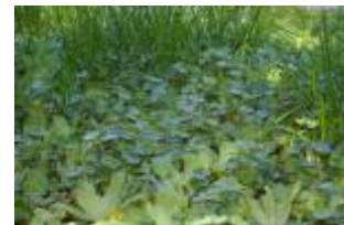
APIACEAE - Hydrocotyle ranunculoides