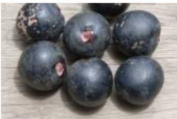
ARECACEAE - Oenocarpus mapora H. Karst.