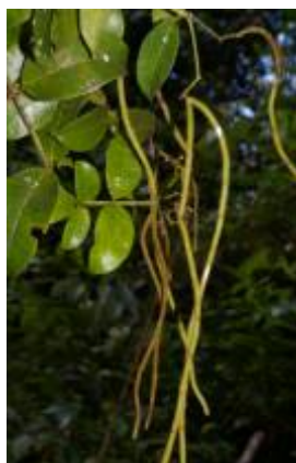
APOCYNACEAE - Condylcarpon pubiflorum Müll. Arg.