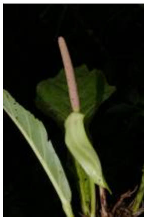
ARACEAE - Anthurium sp. 4