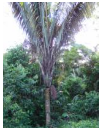
ARECACEAE - Oenocarpus bataua Mart.