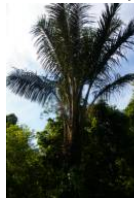
ARECACEAE - Astrocaryum chambira Burret