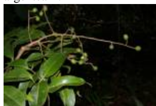
ANACARDIACEAE - Tapirira guianensis Aubl.