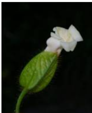
ACANTHACEAE - Mendoncia hoffmannseggiana Nees vel sp. aff