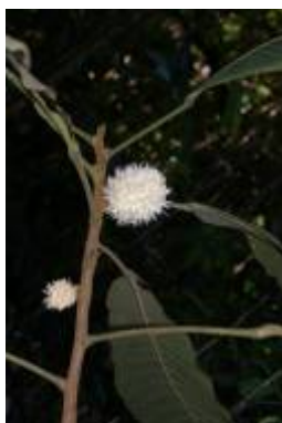
ACHARIACEAE - Carpotroche longifolia (Poepp.) Benth.