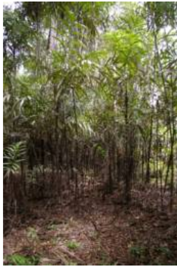
ARECACEAE - Bactris sp. 1