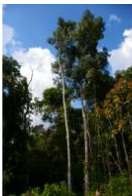
ANNONACEAE - Guatteria elata R.E. Fr.