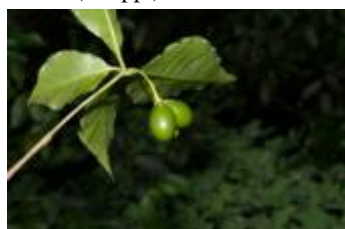
APOCYNACEAE - Rauvolfia sprucei Müll. Arg.