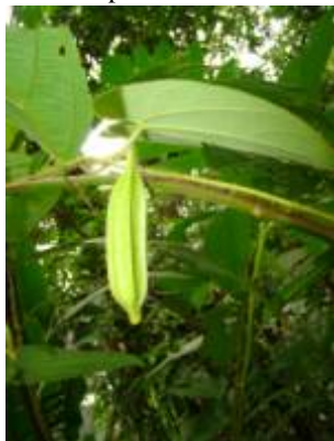
ARISTOLOCHIACEAE - Aristolochia sp. 1