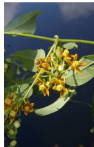
APOCYNACEAE sp. 2