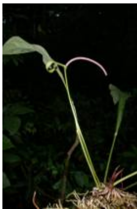
ARACEAE - Anthurium sp. 3