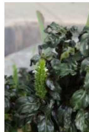
ACANTHACEAE - Teliostachya lanceolata Nees