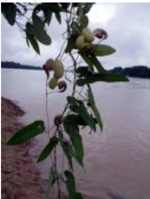
ARISTOLOCHIACEAE - Aristolochia sp. 2