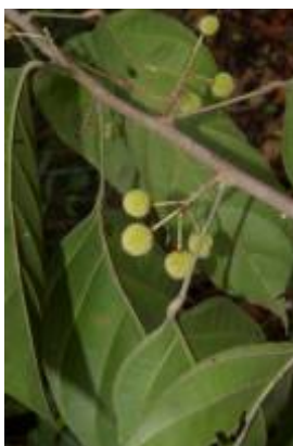
ACHARIACEAE - Lidackeria paludosa (Benth.) Gilg