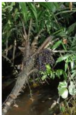
ARECACEAE - Bactris maraja Mart.