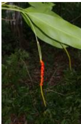
ARACEAE - Anthurium sp. 2