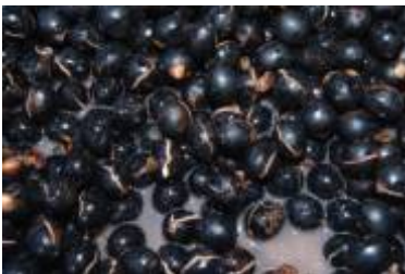
ARECACEAE - Oenocarpus bataua Mart.