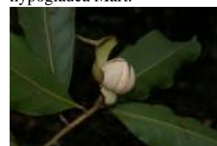
ANNONACEAE - Duguetia spixiana Mart.