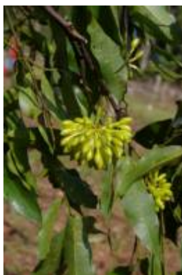
ANNONACEAE - Guatteria elata R.E. Fr.