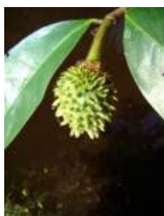
ANNONACEAE - Annona nitida Mart.