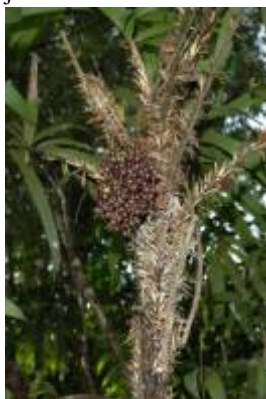
ARECACEAE - Bactris brongniartii Mart.