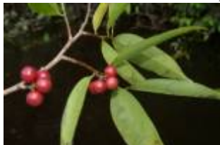
ANNONACEAE - Pseudoxandra polyphleba (Diels) R.E. Fr.