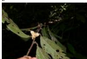
ANNONACEAE - Crematosperma leiophyllum (Diels) R.E. Fr.