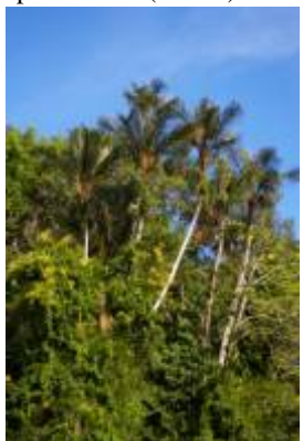
ARECACEAE - Astrocaryum jauari Mart.