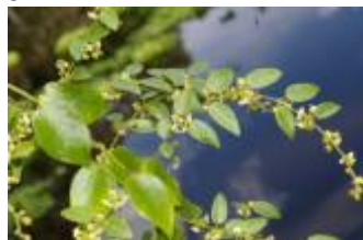
APOCYNACEAE sp. 1