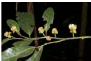
ANNONACEAE - Guatteria sp. 2