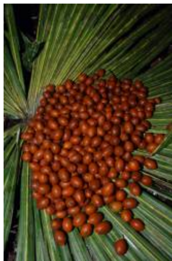
ARECACEAE - Mauritiella aculeata (Kunth) Burret