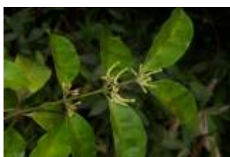
APOCYNACEAE - Lacmellea sp. 1