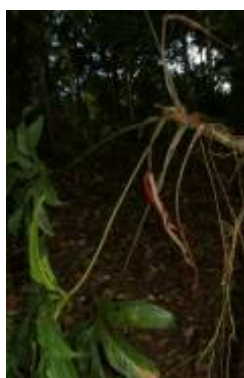
ARACEAE - Anthurium clavigerum Poepp.