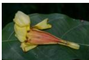
APOCYNACEAE - Odontadenia sp. 1