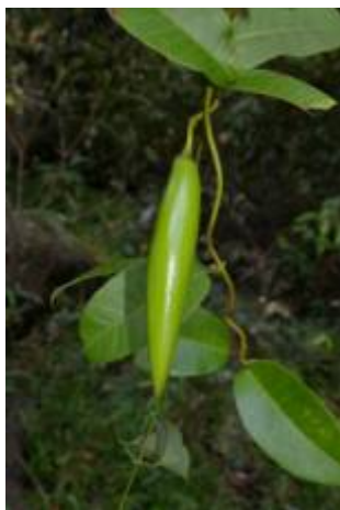
APOCYNACEAE sp. 3