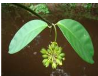
APOCYNACEAE - Prestonia trifida (Poepp.) Woodson