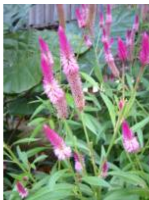
AMARANTHACEAE - Celosia argentea L.