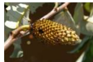
ANNONACEAE - Annona hypoglauca Mart.