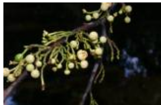
ANNONACEAE - Unonopsis floribunda Diels