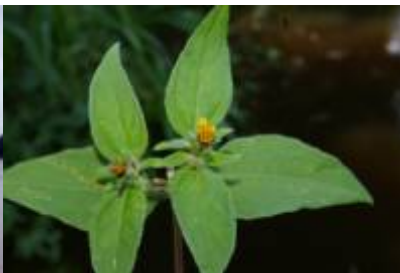
ASTERACEAE - Acmella sp. 1