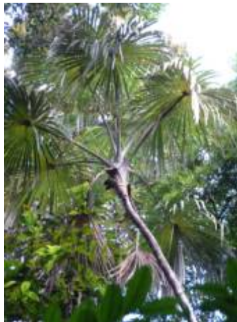
ARECACEAE - Mauritiella aculeata (Kunth) Burret