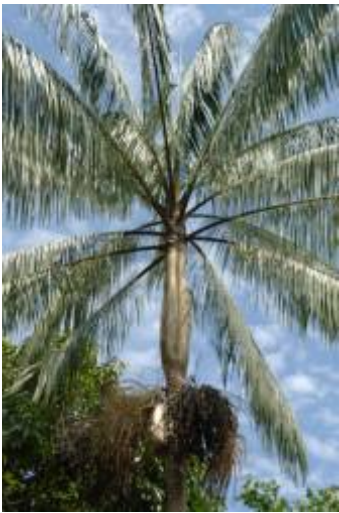
ARECACEAE - Euterpe oleracea Mart.