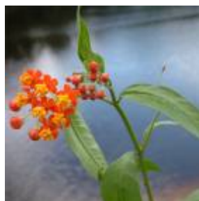
APOCYNACEAE - Asclepias curassavica L.