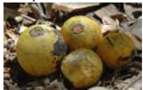
APOCYNACEAE - Couma macrocarpa Barb. Rodr.