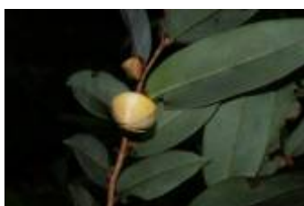
ANNONACEAE - Annona sp. 1