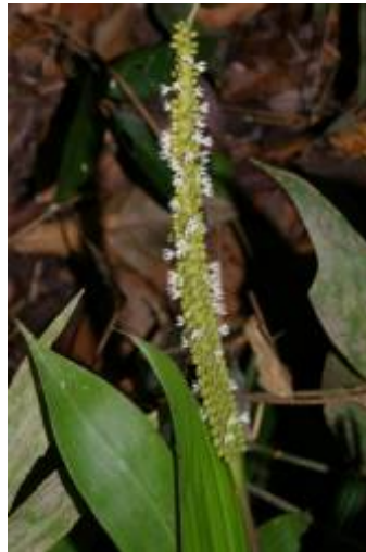
ARECACEAE - Geonoma macrostachys Mart.