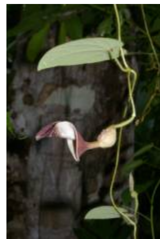
ARISTOLOCHIACEAE - Aristolochia sp. 1