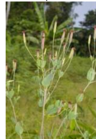
ASTERACEAE - Porophyllum ruderae (Jacq.) Cass.