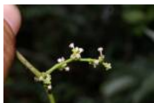
APOCYNACEAE - Mateleia sp. 1