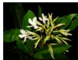
APOCYNACEAE - Himatanthus sucuba (Spruce ex Müll. Arg.) Woodson