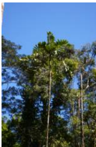
ARECACEAE - Socratea salazarii H.E. Moore