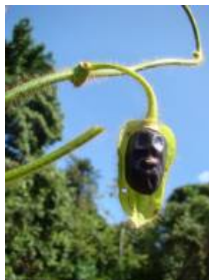
ACANTHACEAE - Mendoncia hoffmannseggiana Nees vel sp. aff