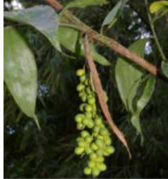
ARECACEAE - Desmoncus sp.1