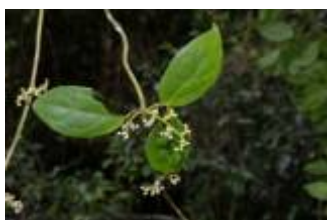
APOCYNACEAE - Mateleia sp. 1