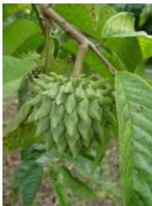
ANNONACEAE - Rollinia mucosa (Jacq.) Baill.