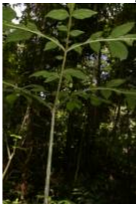
ARACEAE - Dracontium spruceanum (Schott) G.H. Zhu