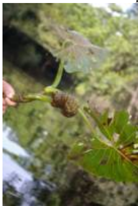
ARACEAE - Montrichardia linifera (Arruda) Schott