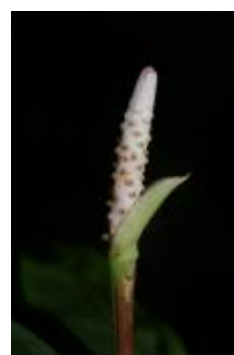
ARACEAE - Anthurium sp. 1