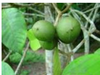
APOCYNACEAE - Tabernaemontana sananho Ruiz & Pav.