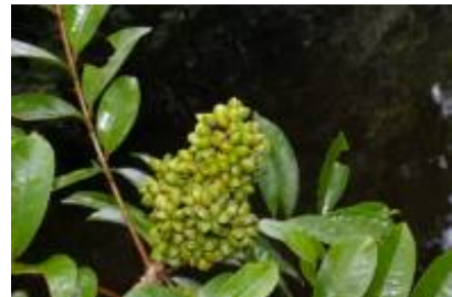
RUTACEAE - Zanthoxylum riedelianum subsp. Kellermanii (P. Wilson)