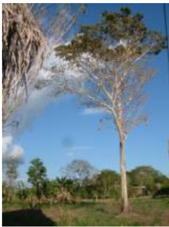
RUBIACEAE - Genipa americana L.