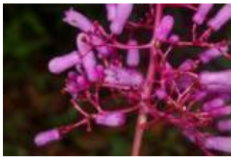
RUBIACEAE - Palicourea lasiantha K. Krause K. Krause