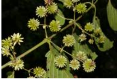
RUBIACEAE - Uncaria tomentosa (Willd. ex Roem. & Schult.) DC.