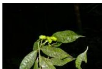
RUBIACEAE - Faramea sp. 3