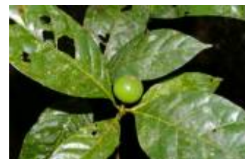
RUBIACEAE - Alibertia sp. 2