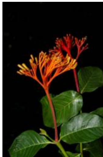
RUBIACEAE - Palicourea croceoides Desv. ex Ham.