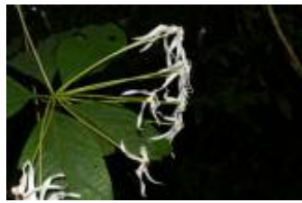
RUBIACEAE - Posoqueria sp