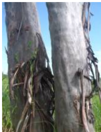
RUBIACEAE - Calycophyllum spruceanum (Benth.) Hook. f. ex K. Schum.