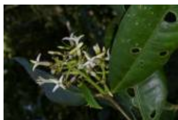
RUBIACEAE - Faramea sp. 2