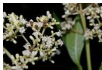
RUBIACEAE - Psychotria sp. 2