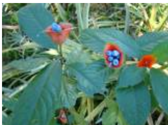
RUBIACEAE - Psychotria poeppigiana Müll. Arg