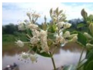
RUBIACEAE - Calycophyllum spruceanum (Benth.) Hook. f. ex K. Schum.