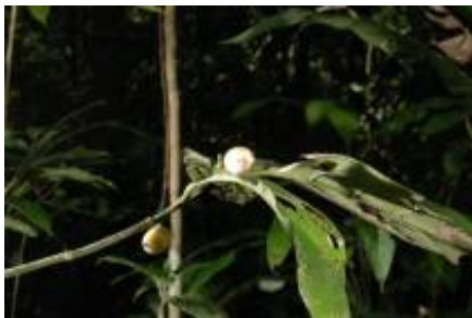
RUBIACEAE - Rudgea lorentensis Standl.