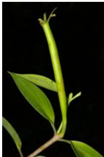
RUBIACEAE - Hillia parasitica Jacq.