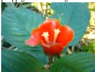
RUBIACEAE - Psychotria poeppigiana Müll. Arg.