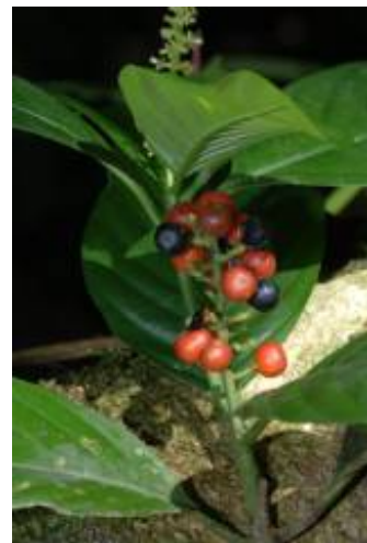
RUBIACEAE - Psychotria longicuspis Müll. Arg