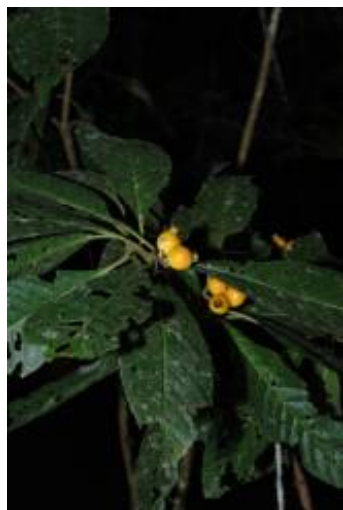
RUBIACEAE - Alibertia edulis (Rich.) A. Rich. ex DC.