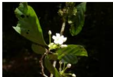
RUBIACEAE - Randia armata (Sw.) DC.