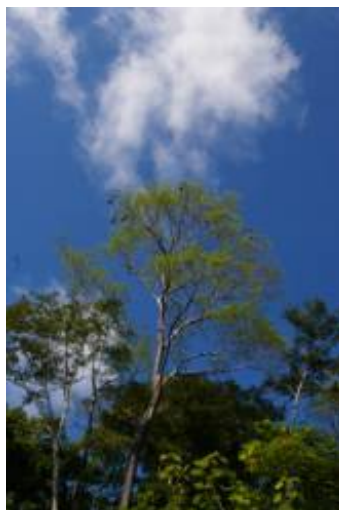
RUBIACEAE - Calycophyllum spruceanum (Benth.) Hook. f. ex K. Schum.