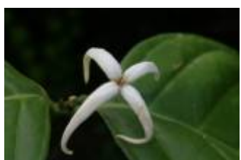
RUBIACEAE - Coussarea brevicaulis K. Krause