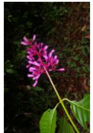
RUBIACEAE - Palicourea lasiantha K. Krause K. Krause