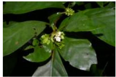
RUBIACEAE - Sommeria sabiceoides K. Schum.