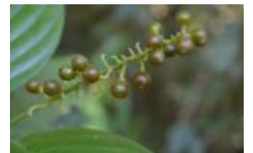
RUBIACEAE - Psychotria sp. 3