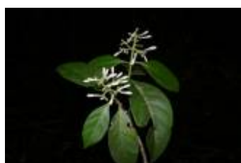
RUBIACEAE - Coussarea hirticalyx Standl