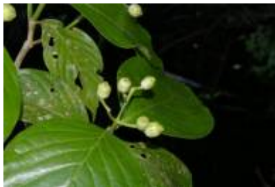
RUBIACEAE - Rudgea obesiflora Standl. vel sp. aff.