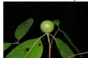
RUBIACEAE - Alibertia sp. 3