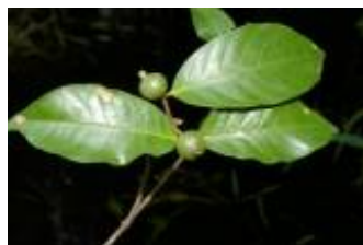
RUBIACEAE - Alibertia sp. 1