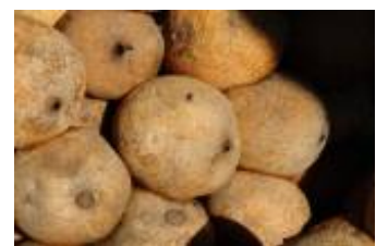
RUBIACEAE - Genipa americana L.