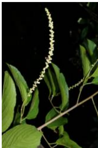
RHAMNACEAE - Gouania lupuloides (L.) Urb.