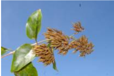
RUBIACEAE - Uncaria guianensis (Aubl.) J. F. Gmel.