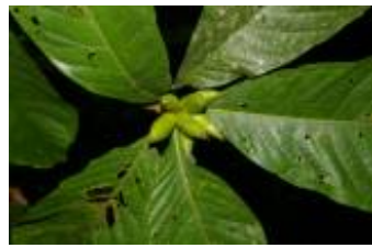
RUBIACEAE - Posoqueria sp