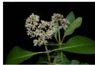
RUBIACEAE - Psychotria sp. 2