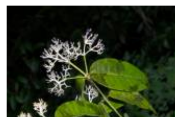
RUBIACEAE - Faramea sp. 1