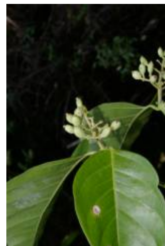
RUBIACEAE - Coussarea cornifolia (Benth.) Benth. & Hook. f.