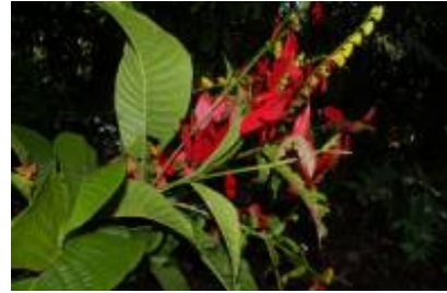
RUBIACEAE - Warszewiczia coccinea (Vahl) Klotzsch