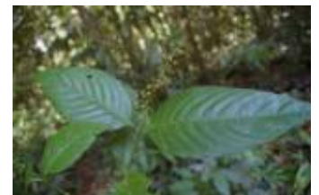
RUBIACEAE - Psychotria sp. 3