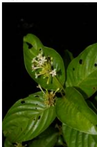
RUBIACEAE - Chomelia paniculata (Bartl. ex DC.) Steyererm.