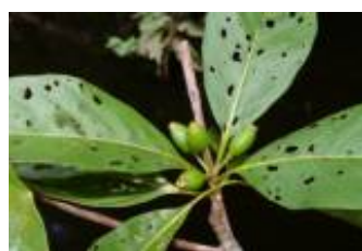
RUBIACEAE - Duroia petiolaris Spruce ex K. Schum