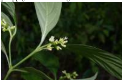
RUBIACEAE - Psychotria sp. 4