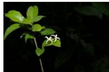
RUBIACEAE - Randia boliviana Rusby vel sp. aff.