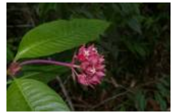
RUBIACEAE - Psychotria sp. 1